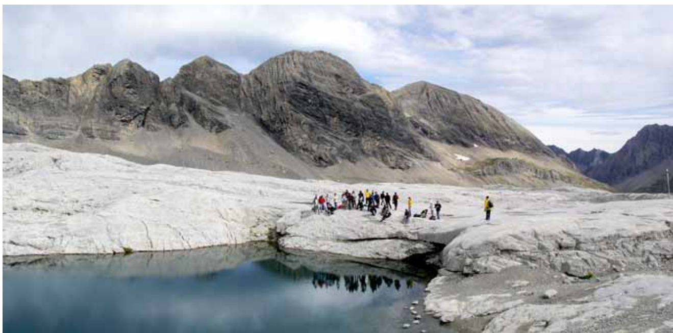
Photo 1 - En excursion sur les lapiés de Tsanfleuron (Valais, Suisse), le 16 septembre 2006.

Monsieur Jean Nicod qui a bien voulu compléter et vérifier la liste récapitulative des Journées et Tables rondes de l'A. F. K.